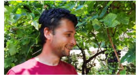
アストリス スプマンテ メトドクラシコ Spumante di Qualita Metodo Classico Pas Dose